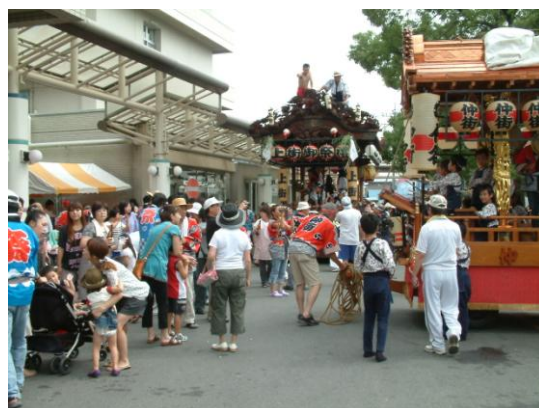
昨年のお祭り風景

鶴谷病院として、毎年恒例となっています「境ふるさと祭り」への参加を今年も行います。鶴谷病院及び鶴寿園玄関前で、各町内からの山車や神輿をお迎えいたします。患者さま、患者さまご家族に病院及び鶴寿園への出入りで、ご不便をおかけする場合がありますがご容赦をお願いいたします。